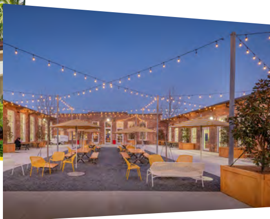
Nutzungsart Büro und Einzelhandel: Büro- und Einzelhandelsimmobilie Optimist Hall Charlotte, North Carolina

Die Vorgängerfonds Jamestown 27 bis 31 wurden wie auch Jamestown 32 als Blindpool konzipiert. Die getätigten Investitionen der Vorgängerfonds weisen eine breite Diversifikation auf. So wurden zahlreiche Gebäude mit verschiedenen Nutzungsarten in unterschiedlichen Metropolregionen der USA gekauft, bewirtschaftet, weiterentwickelt und teilweise wieder verkauft – von Büro- über Einzelhandel- bis hin zu Mietwohnobjekten.