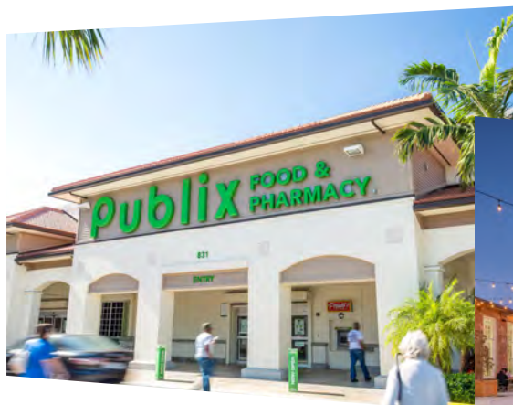
Nutzungsart Einzelhandel: Shoppingcenter Polo Club Shops Boca Raton, Florida