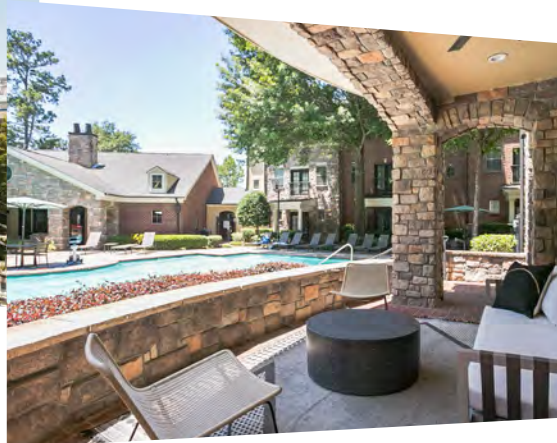
Nutzungsart Wohnen: Mietwohnanlage Rock Springs Court Atlanta, Georgia