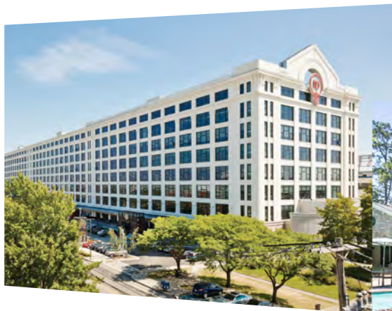
Nutzungsart Büro, Labor und Einzelhandel: Bürokomplex Innovation and Design Building Boston, Massachusetts